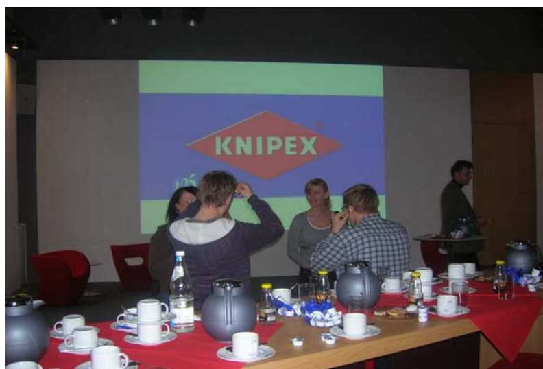
Begrüßung bei Knipex

Am nächsten Morgen konnten sich die Gäste einen Eindruck von den Besonderheiten der Bergischen Werkzeugindustrie verschaffen: Das Unternehmen KNIPEX-Werk C. Gustav Putsch KG Zangenfabrik-Gesenkschmiede gewährte Einblicke in die Produktion und Unternehmensgeschichte. Besonders gelobt wurde die fachkundige Führung, welche Auszubildende des Unternehmens selbständig planen und durchführten.