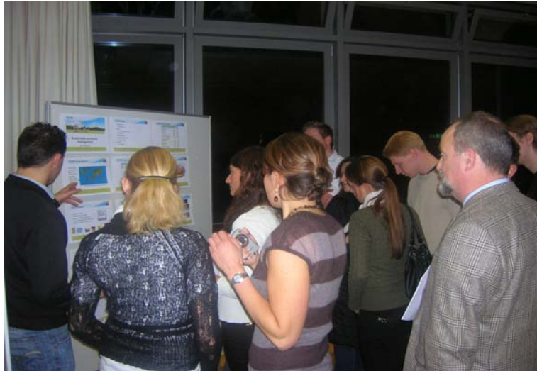
Markt der Möglichkeiten

Am nächsten Morgen konnten sich die Gäste einen Eindruck von den Besonderheiten der Bergischen Werkzeugindustrie verschaffen: Das Unternehmen KNIPEX-Werk C. Gustav Putsch KG Zangenfabrik-Gesenkschmiede gewährte Einblicke in die Produktion und Unternehmensgeschichte. Besonders gelobt wurde die fachkundige Führung, welche Auszubildende des Unternehmens selbständig planen und durchführten.