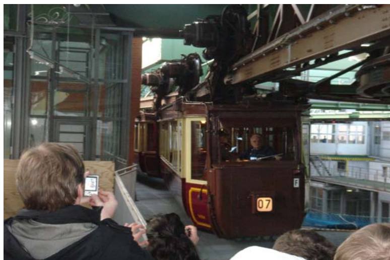
Ankunft des Kaiserwagens

Über dem Wasser der Wupper erfolgte die Erkundung der Stadt im historischen Kaiserwagen der Schwebebahn. Unterstützt durch den VLW hatten hier auch die örtlichen Verbandsmitglieder die Möglichkeit, die Finnen zu begleiten und erste Kontakte zu knüpfen.