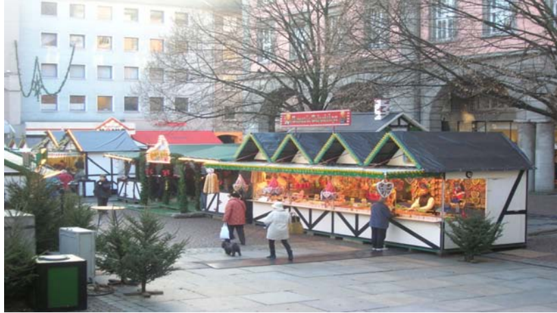
Weihnachtsmarkt in Barmen (am frühen Morgen)

Am darauffolgenden Tag waren die Studierenden aufgefordert, in einer weiteren Arbeitsphase ihre Ergebnisse zu vervollständigen und zu präsentieren. Viele unterschiedliche Produkte wurden vorgestellt: Kaffeeverkostung, Schautafeln zur Entwicklung des Kaffeemarktes, Powerpointpräsentationen zu den Kaffeelabels, Besichtigung und Vorstellung des Unternehmens Starbucks sowie Berichte über die Unterschiede finnischer und deutscher Kaffeeketten.